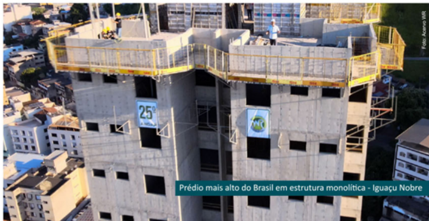
Prédio mais alto do Brasil em estrutura monolítica - Iguazu Nobre